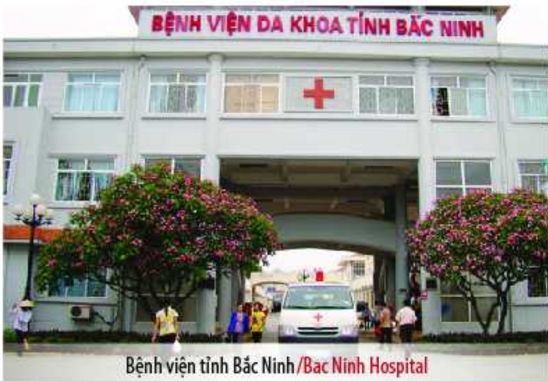
Bệnh viện tỉnh Bắc Ninh /Bac Ninh Hospital