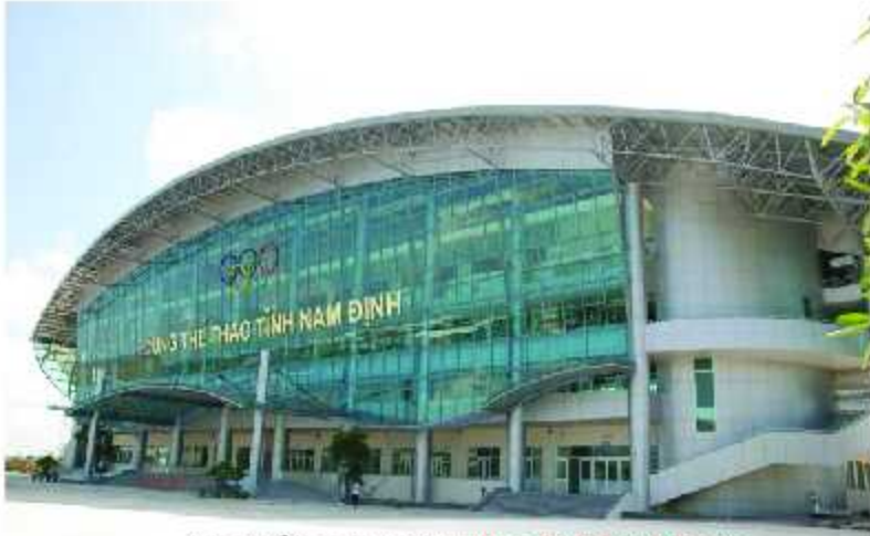
Cung thể thao Nam Định /Nam Dinh Sports Centre