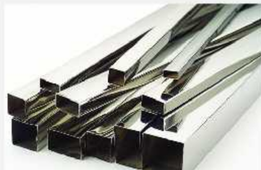
Hộp vuông, hộp chữ nhật Stainless steel welded square tubes /rectangular tubes