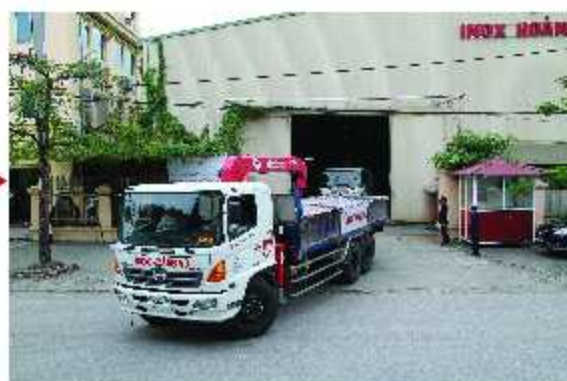
Giao hàng / Delivery