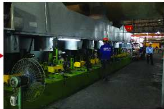
Máy đánh bóng / Polishing BA