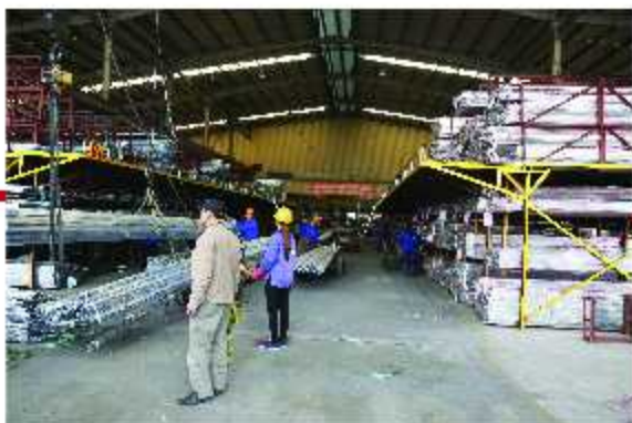
Kho hàng / Warehouse