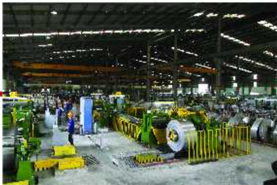
Xẻ băng / Slitting line