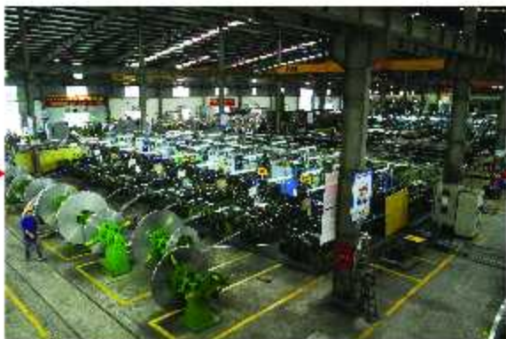
Máy lốc / Forming