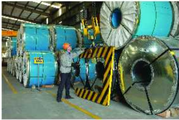
Nguyên liệu cuộn cán nóng / Hot rolled material