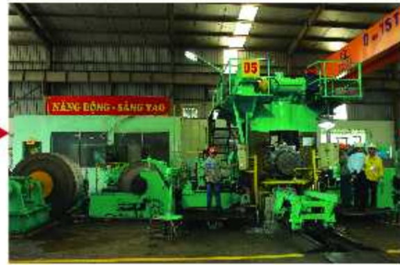
Máy cán lạnh 04 trục / 4 axis - Cold rolling mill