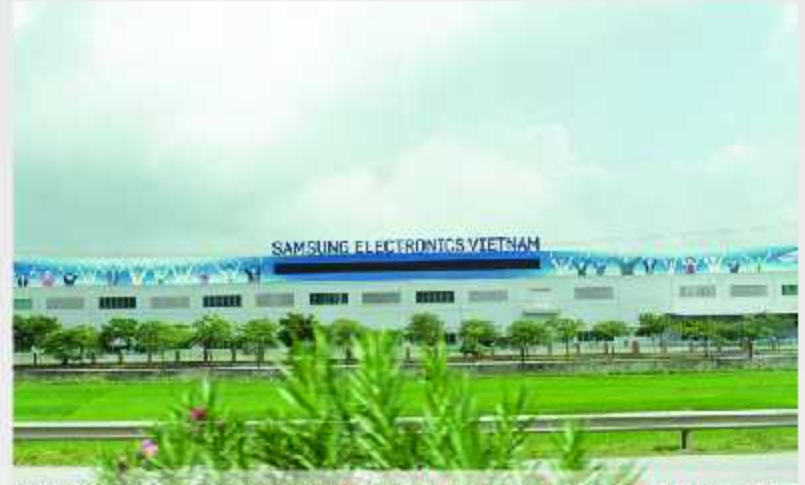
Nhà máy Sam Sung Thái Nguyên /Samsung Electronics Factory - Thai Nguyen City