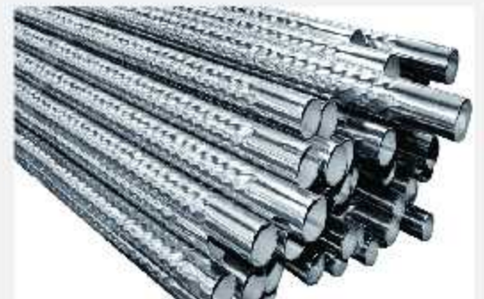
Inox xoắn Stainless steel twisted tubes