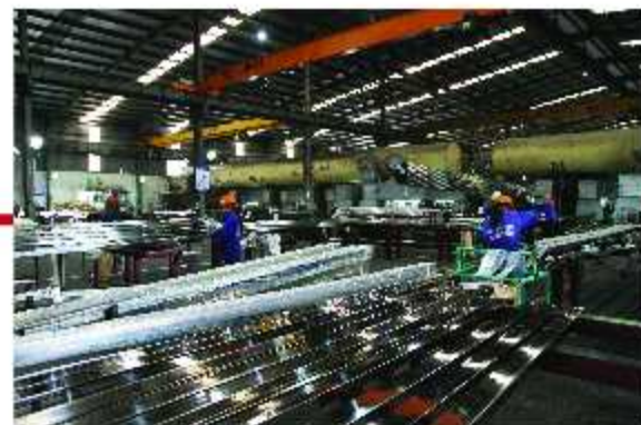
Đóng gói / Packing