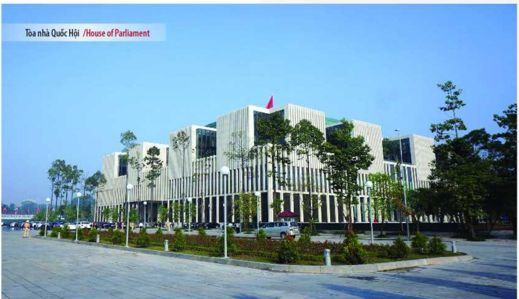
Tòa nhà Quốc Hội /House of Parliament