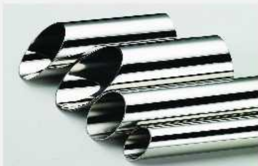
Ống tròn Stainless steel welded round tubes