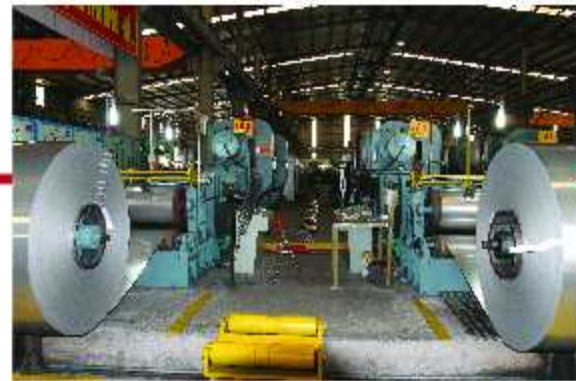
Ủ sáng / Bright annealing